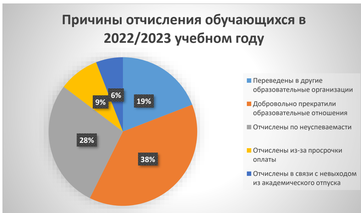
Рисунок 2 – Причины отчисления обучающихся в 2022/2023 учебном году