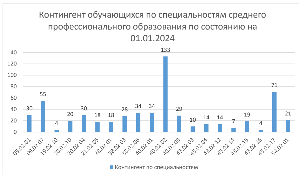
Рисунок 1 - Контингент обучающихся по специальностям среднего профессионального образования по состоянию на 01.01.2024

Положительно выделяются специальности 09.02.07 Информационные системы и программирование, 40.02.02 Правоохранительная деятельность и 43.02.17 Технологии индустрии красоты, которые традиционно популярны у обучающихся.