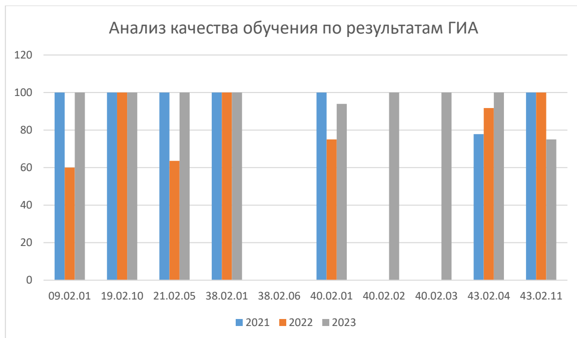
Рисунок 4 - Качество обучения (количество получивших оценки «4» и «5» по результатам ГИА) за последние три года